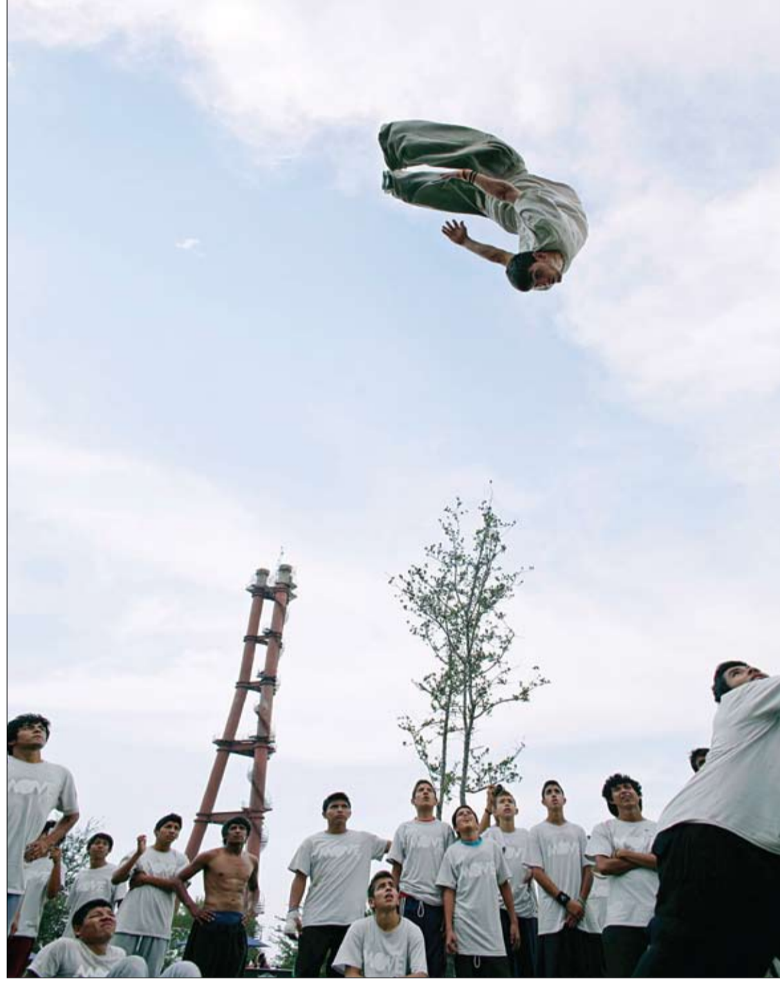
صبي يمارس مهارات الباركور في فونديدورا بارك بونديورا في المكسيكية ضمن برنامج حكومي لتشغيل أوقات فراغ الشباب بصورة رياضية ناعمة لتقليل فرص تورطهم مع عصابات الجريمة أو الانحراف باتجاه المخدرات. (رويترز)

يعاني ملايين الناس مما يعرف بأمراض العصر الحديث، ويلجأ كثيرون إلى تعاطي عقاقير طبية غالية الثمن. وأوضح البروفيسور فينتريد باننسر من معهد علوم الرياضة في جامعة فرانكفورت لوقع انا زهرة أن الأمراض التي تحدث بسبب الشراء وارتفاع مستوى المعيشة تعالج عبر ممارسة الرياضة. وتتمثل هذه الأمراض في الأعراض الخاصة بأمراض القلب والأوعية الدموية، والاضطرابات في عملية التمثيل الغذائي التي يمكن علاجها عن طريق الحركة. ويقول البروفيسور الألماني إن من المستغرب عدم الاعتناء بالرياضة كحل بديل ذي كلفة أقل نسبياً. من جانبه، يقول بيرند فولنرات خبير الطب الرياضي في المستشفى التابعة للجامعة التقنية في مدينة ميونيخ إنه قد ثبت أن من الممكن خفض كلفة النفقات على العقاقير الطبية من خلال ممارسة قدر مناسب من الرياضة. وضرب مثلاً على ذلك مرضى السكري، إذ تبين أنه مع زيادة الفترة الزمنية التي يخصصها هؤلاء لممارسة النشاط البدني، تقل تكلفة نفقاتهم على العقاقير الطبية. وأشار الخبير الألماني إلى أن المواظبة على ممارسة الرياضة تحسن حالة الأوعية الدموية وتخفض من ضغط الدم بصورة أفضل من الأدوية المخصصة لذلك.