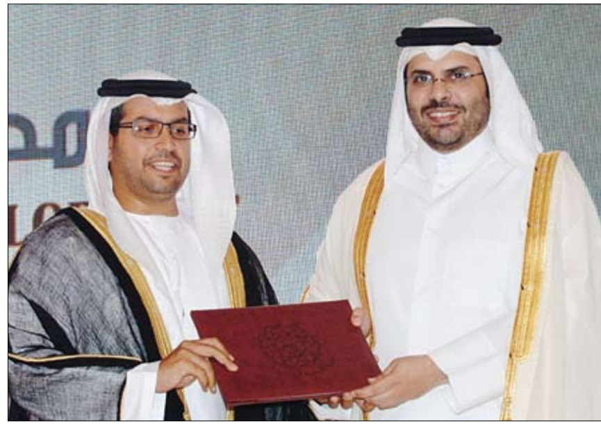
ضمن جوائز منظمة المدن العربية